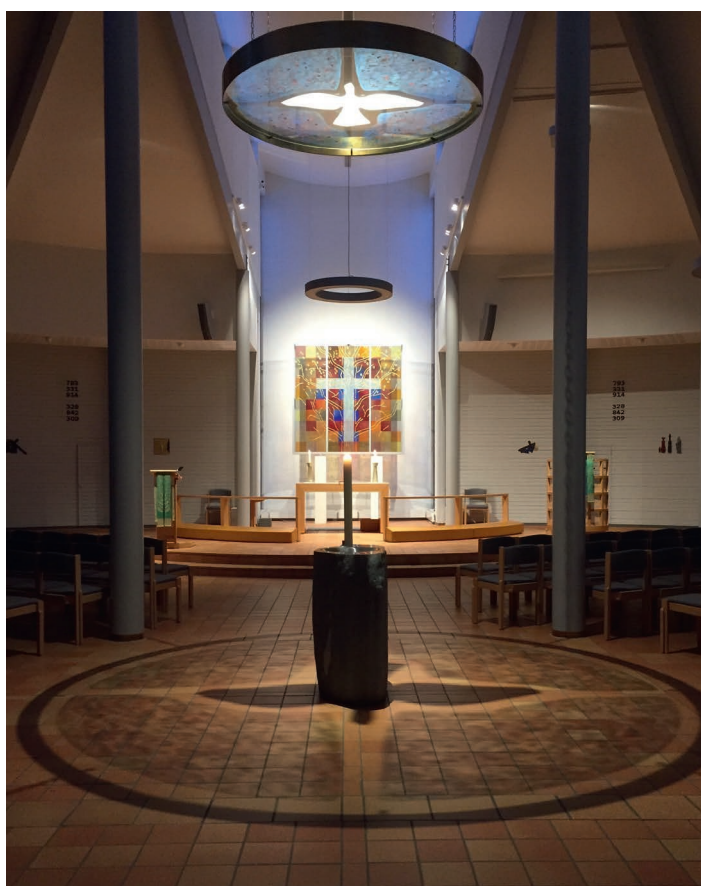
Interiør i Rønvik kirke.

Lørdag 16. november er Rønvik kirke åpen for drop-in dåp. Denne dagen er det muligheter for å bli døpt, uten at dette er avtalt og planlagt i lang tid på forhånd. Alle som ønsker det, uansett alder, kan få komme og bli døpt denne dagen. Du inviteres til en kort samtale i forkant, før dåpen finner sted i kirkerommet. Dåpen er en gave, en hellig handling der vi blir tatt imot av Guds nåde. Dåpen gir oss tilhørighet hos Gud, og vi blir tegnet med korset tegn «til vitnesbyrd om at vi skal tilhøre den korsfestede og oppstandne Jesus Kristus og tro på han».