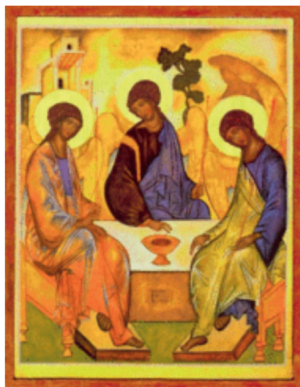
Andrej Rubljov: Treenigheten.

Areopagos arbeider med religionsdialog, kristen åndelighet og trospraksis, og bistand. Hovedmålet er å dele evangeliet i en religiøst mangfoldig og sekularisert verden, i Skandinavia, Kina og Hongkong.