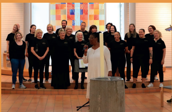
Bodø Gospel Blend Choir holdt konsert i kirkerommet.